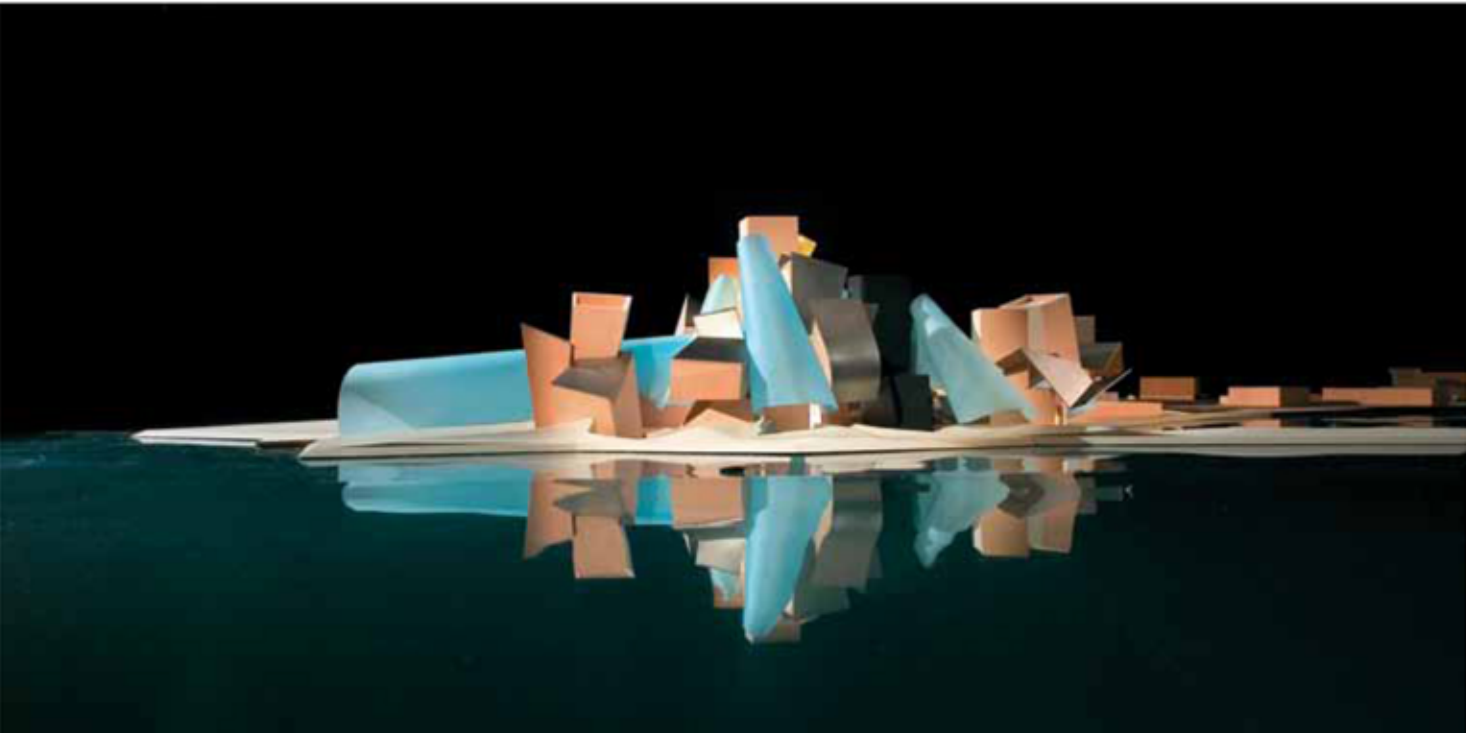
Guggenheim Abu Dhabi Project

Guggenheim kurumunun yöneticisi Richard Armstrong'a gönderildi. İnsan Hakları İzleme Örgütü'nün sağladığı bilgi doğrultusunda bakıldığında Guggenheim inşaatında çalışan işçilere yönelik insan hakları ihlali yapıldığı iddiası, bu işçilerin günümüzün bir nevi sözleşmeli köleleri olduğunu anımsatıyordu. Suçlamalar, yasa dışı işçi alım ücretlerinin aşırı düzeyde gösterilmesi, asıl çalışanların ödemelerine uymayan maaş vaatleri, kötü yaşam şartları ve gerekli sağlık koşullarının ihlalini içeriyordu. Bu talep mektupları, ihlallerin Guggenheim'in itibarına zarar verdiğini ve ortada müzenin Abu Dhabi işbirlikçilerinden kaynaklanan temel bir moral bozukluğu olduğunu öne sürüyordu. Dünyanın en bilinen petrol rezervlerinin tahmini olarak % 7.25'ine veya yaklaşık olarak 98 milyar petrol variline sahip olan Birleşik Arap Emirlikleri, petrol rezervleri ile petrol üretimi konusunda dünyada yedinci sırada. Yedi emirlikten meydana gelen bir federasyon olan Birleşik Arap Emirlikleri, emirler tarafından yönetiliyor ve sıklıkla "anlaşmalı" devletlere (Trucial States)