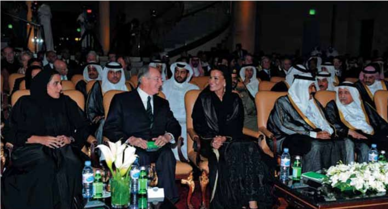
Sheikha Al Mayassa Bint Hamad Al Thani, Aga Han Mimarlık Ödülleri Töreni'nde, Islam Sanati Müzesi, Doha, Qatar