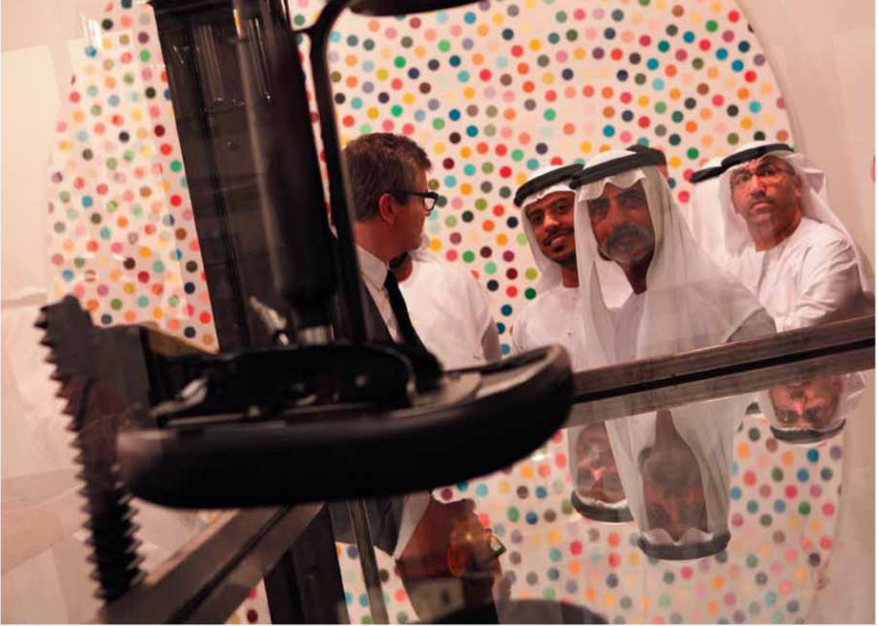
Sheikh Sultan bin Tahnoon Al Nahyan ile Sheikh Nahyan bin Mubarak Al Nahyan, Dubai Art Fair, 2010