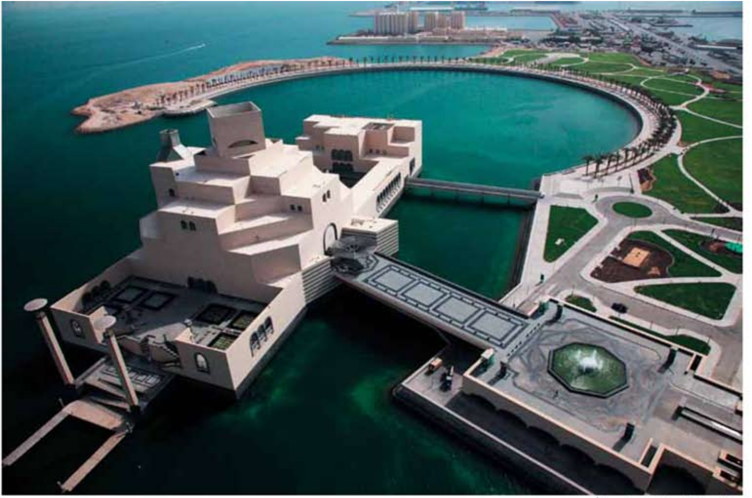
İslam Sanatı Müzesi, Doha, Qatar.