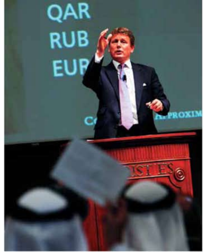
Christie's Dubai, 2010