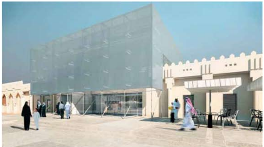
Mathaf - Arap Modern Sanat Müzesi