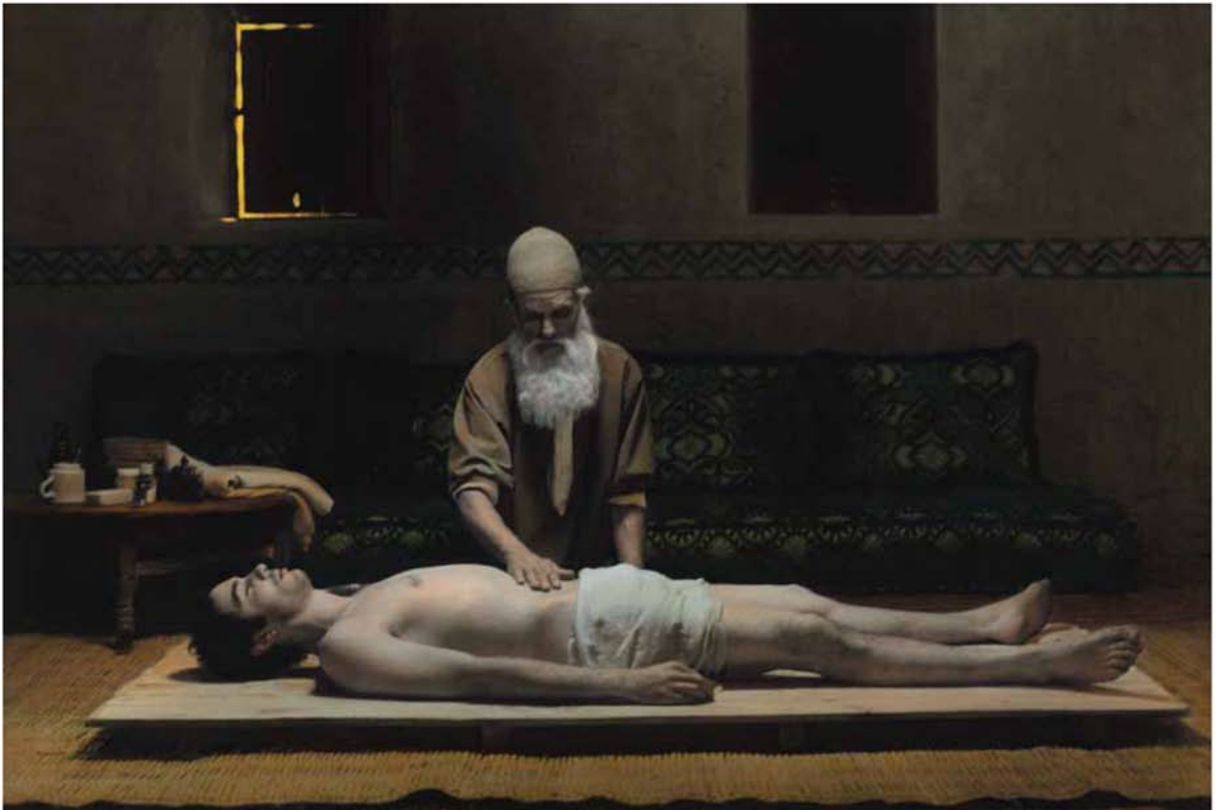
Youssef Nabil, Hiç Gitmedin, 2010.