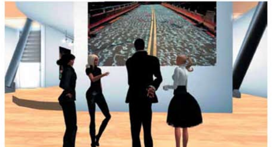
Basmoca Sanal Müzesi